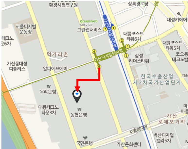
가산디지털단지 역 5번 출구 도보 5분