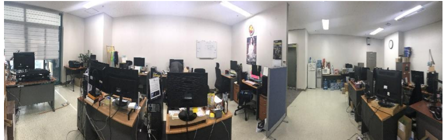
ATOZ 변화 및 내부 사진

HEAD OFFICE 서울특별시 금천구 가산디지털 2로 108 뉴티캐슬 511호